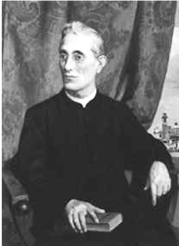
Ritratto di Don Tadino